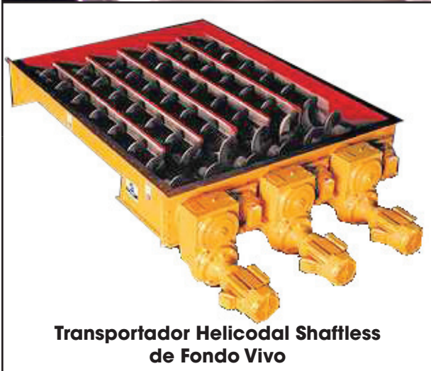
Transportador Helicodal Shaftless de Fondo Vivo